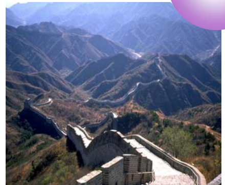
กำหนดการเดินทาง